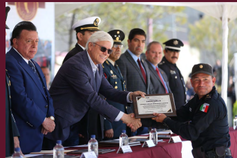
Egresan agentes de Guardia Estatal y policías municipales