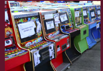
Decomisan 21 máquinas tragamonedas