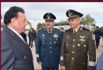
Fiscal General asiste a toma de protesta de Comandante de II Zona Militar