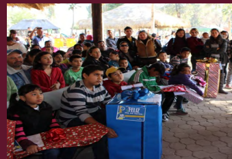
Atienden casi 2 mil niños en talleres contra el bullying